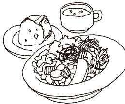
新鮮野菜の サラダボウル VEGETABLE SALAD BOWL [スープ+パン付] 1200