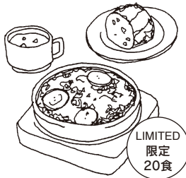
今週のグラタンランチ WEEKLY GRATIN LUNCH [スープ+パン付] 1200