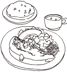
GMC週替わりランチ WEEKLY LUNCH [スープ+パンorライス付] 1100