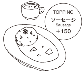
季節野菜のカレーランチ TODAY'S VEGETABLES CURRY [スープ付] 1000